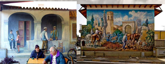
Due dei centinaia di murales sparsi per il paese

Visita il sito http://www.sansperate.com/