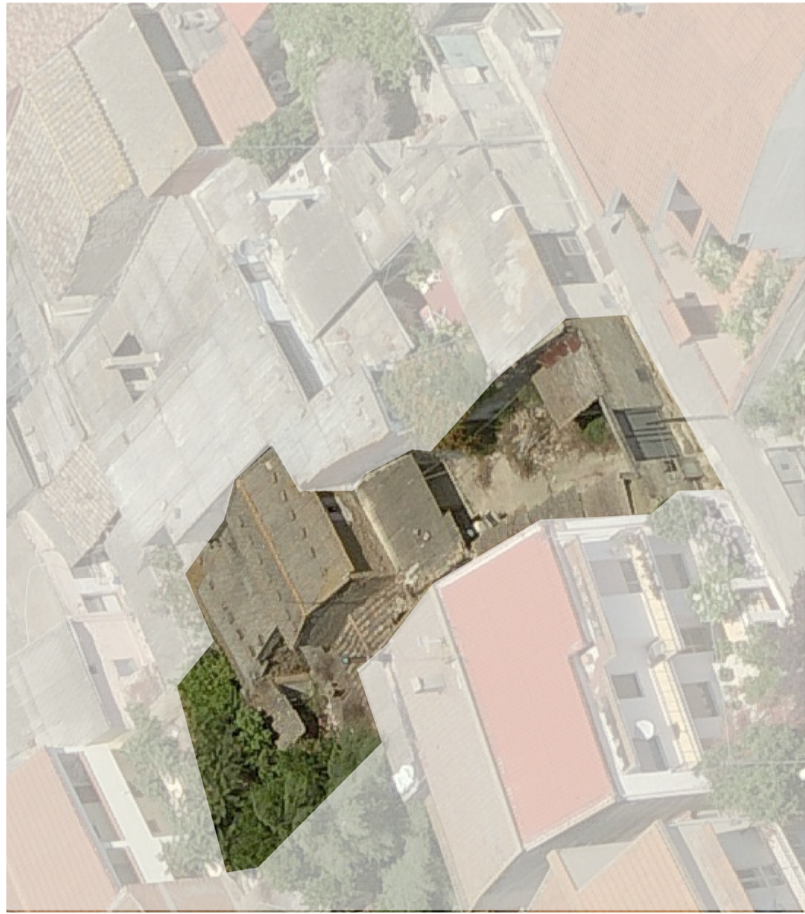
Foto obliqua stato attuale