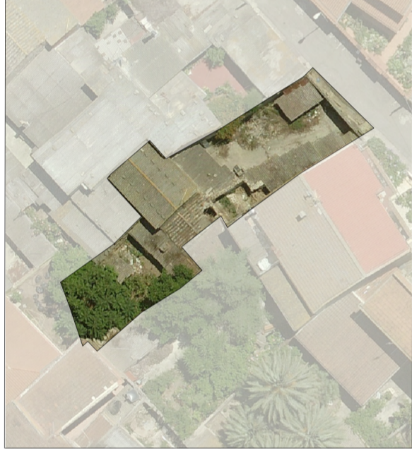
Ortofoto dello stato attuale scala 1:500