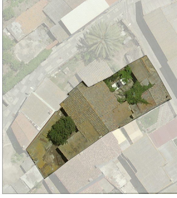
Ortofoto dello stato attuale scala 1:500

superficie lotto 592.85 mq superficie coperta 298.43 mq superficie libera 294.42 mq volume edificato 909.69 mc altezza massima di gronda 4.50 m indice fondiario 3 mc/mq indice di fabbricazione 1.53 mc/mq larghezza fronte strada 19.85 m (via Sant'Elena ) uso residenziale numero livelli piano terra