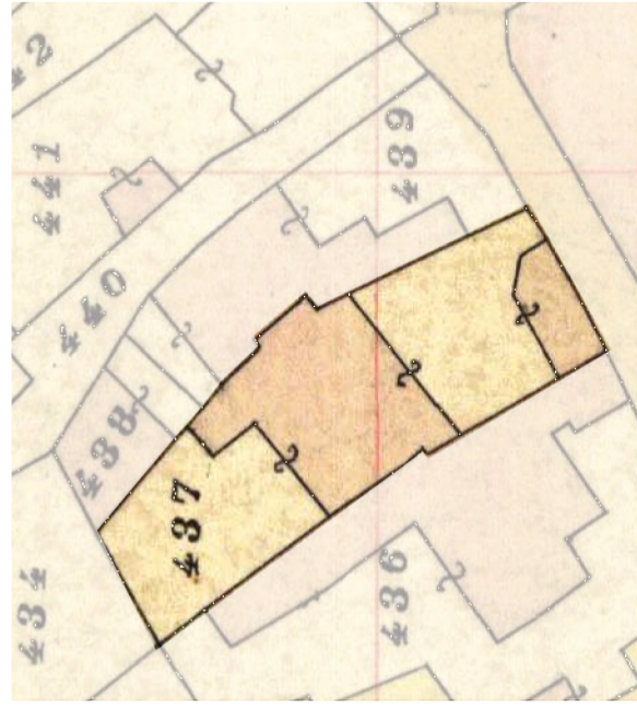
Individuazione tipologia storica _ Carta di impianto 1939 scala 1:500