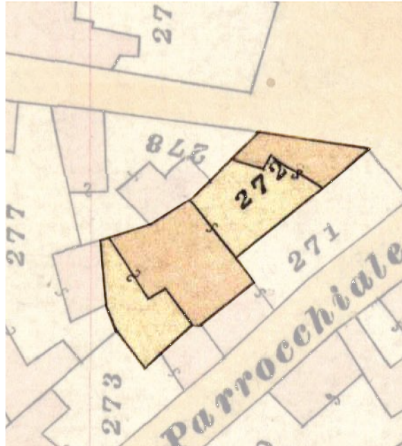
Individuazione tipologia storica _ Carta di impianto 1939 scala 1:500