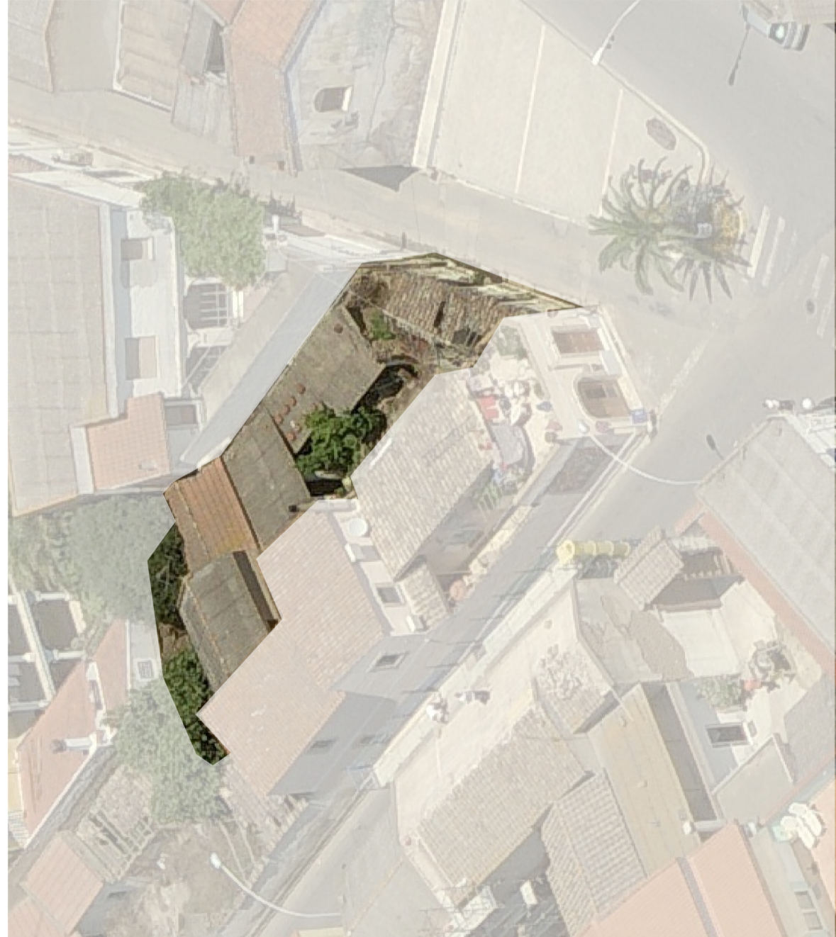
Foto obliqua stato attuale