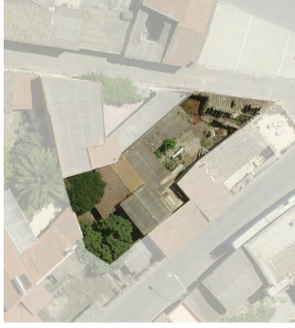
Ortofoto dello stato attuale scala 1:500

superficie lotto 231.00 m 2 superficie coperta 154.40 m 2 superficie libera 76.60 m 2 volume edificato 527.15 m 3 altezza massima di gronda 5.30 m indice fondiario 3 mc/mq indice di fabbricazione 2.28 m 2 /m 3 larghezza fronte strada 11.35 m uso residenziale numero livelli piano terra e primo piano